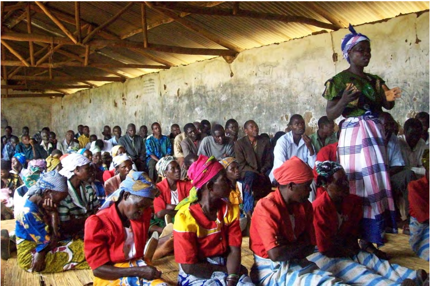
MOBILISERING: Bønder i Malawi organiserer seg for å stå sterkere.

ing av sivilsamfunnet i Sør, spesielt bondeorganisasjoner og andre sosiale bevegelser.