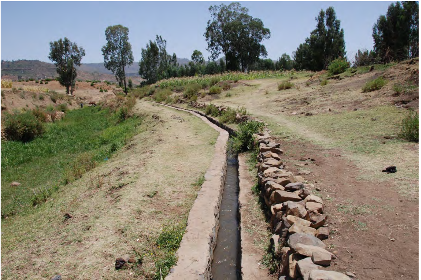
LIVSVIKTIG VANN: Utviklingsfondet støtter utbygging av vanningsystemer for småbønder. Slike vanningsystemer, som her fra Adwa i Etiopia, bedrer matsikkerheten og begrenser sårbarheten som følge av klimaendringer.

matproduksjon og miljøpolitikk. I dag ser vi at nærmere en milliard mennesker sulter. Spekulasjon på matvarebørser, eksportorientering av matproduksjon, liberalisering av handelen med mat og miljøødeleggelser er blant viktige drivkrefter for denne utviklingen. Menneskeskapte klimaendringer er en realitet og bidrar til redusert matproduksjon og økt fattigdom. Biologisk mangfold går tapt og økosystem degraderes. Ytterligere økonomisk vekst uten hensyn til mennesker og miljø vil forsterke disse utfordringene, framfor å løse dem. Handelsliberalisering gjennom Verdens handelsorganisasjon og bilaterale frihandelsavtaler fremmer økonomisk vekst som ikke sikrer rettferdig fordeling eller unngår over-