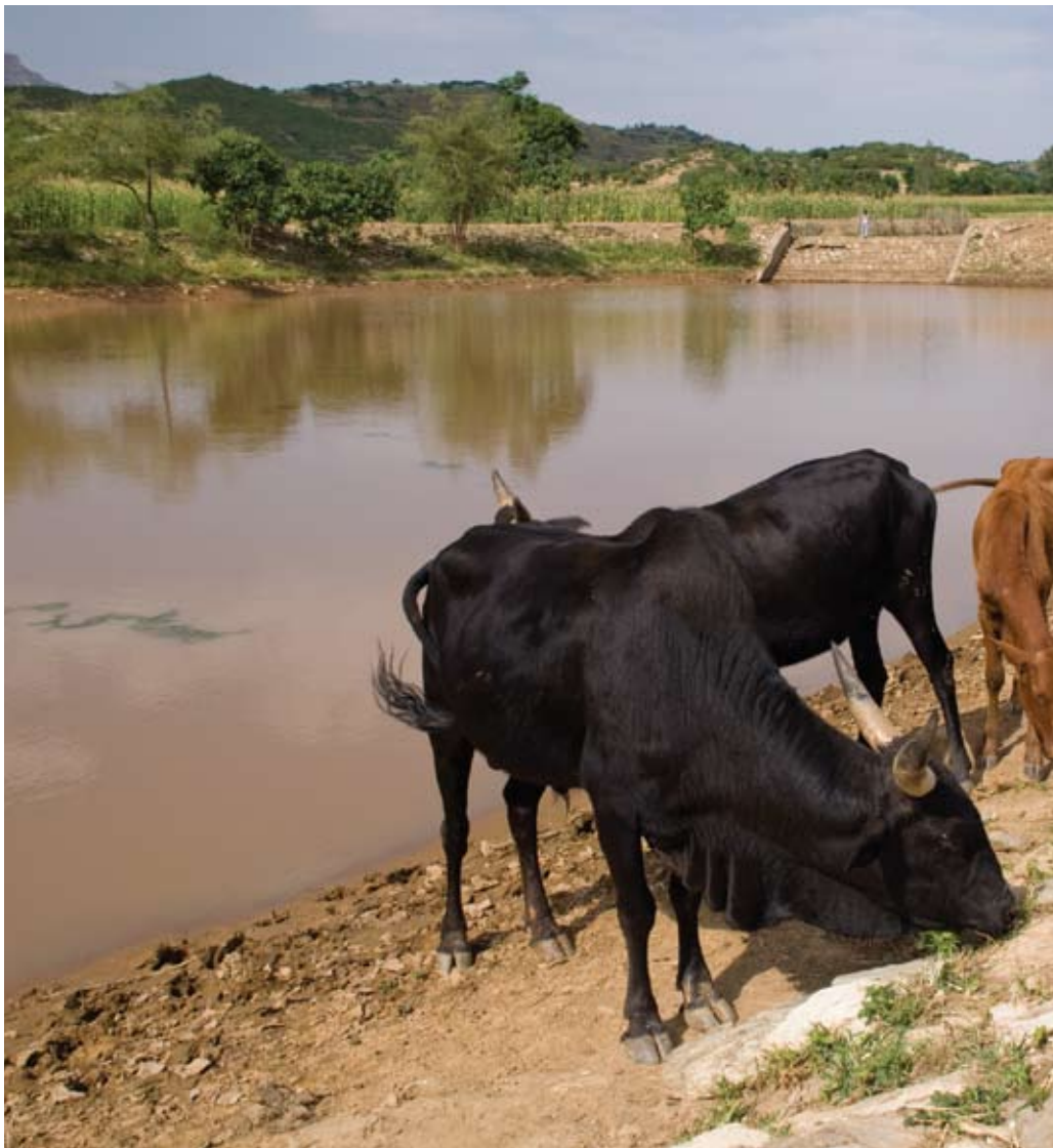
En jente gjeter kyr ved et større vannreservoar i Tigray. Det kollektive arbeidet som ligger bak dem

*For ordens skyld og kort fortalt; Utviklingsfondet er en norsk miljø- og utviklingsorganisasjon som støtter prosjekter og organisasjoner i Afrika, Asia og Latin-Amerika og arbeider for politiske endringer for å skape en bedre verden.