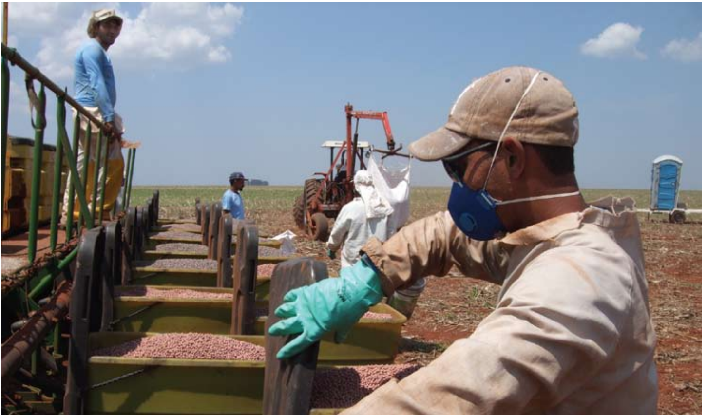
Brasil opplever en voldsom vekst i avlingene. Men mister de noe underveis?