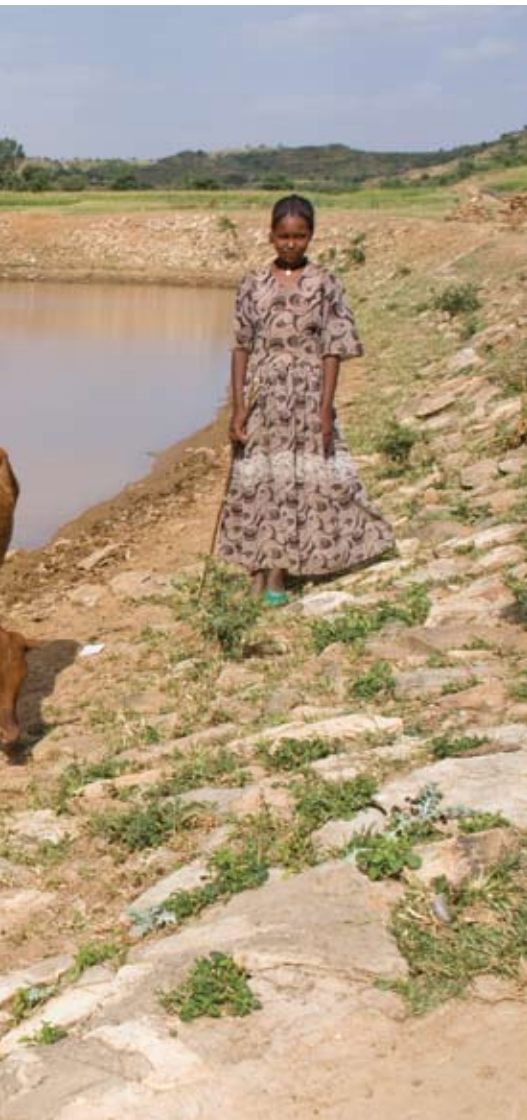
Infrastrukturen har imponert flere av våre ansatte.

meste som foregår. Hun lærer bort nye dyrkningsmetoder til bønder i lokalsamfunnet og jobber med en støttegruppe for folk med hiv og aids. Slike personer gjør et sterkt inntrykk.